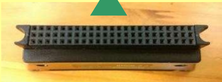
アダプタ側コネクタ (メス)

突起の間隔をアダプタ側と比較すると・・・ 白エンジンはギリギリ同じくらい。 コアグラ(コアグラⅡ)はやや狭い。